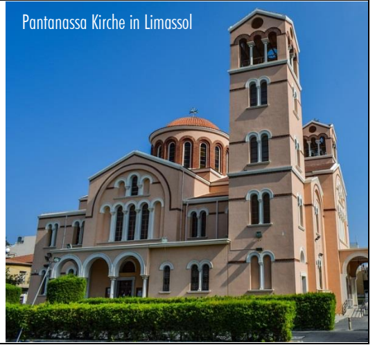
Pantanassa Kirche in Limassol

1. Tag: Flug nach Larnaca . Empfang durch Reiseleitung. Transfer zum Park Beach Hotel . Hotelbezug für 8 Nächte in Limassol .